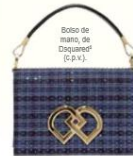
Bolso de mano de Diquiero (p.p.).