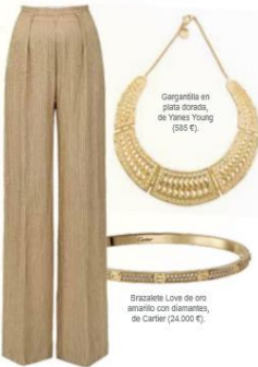
Gargantilla en perla tonda, de Yanes Young (385 €).